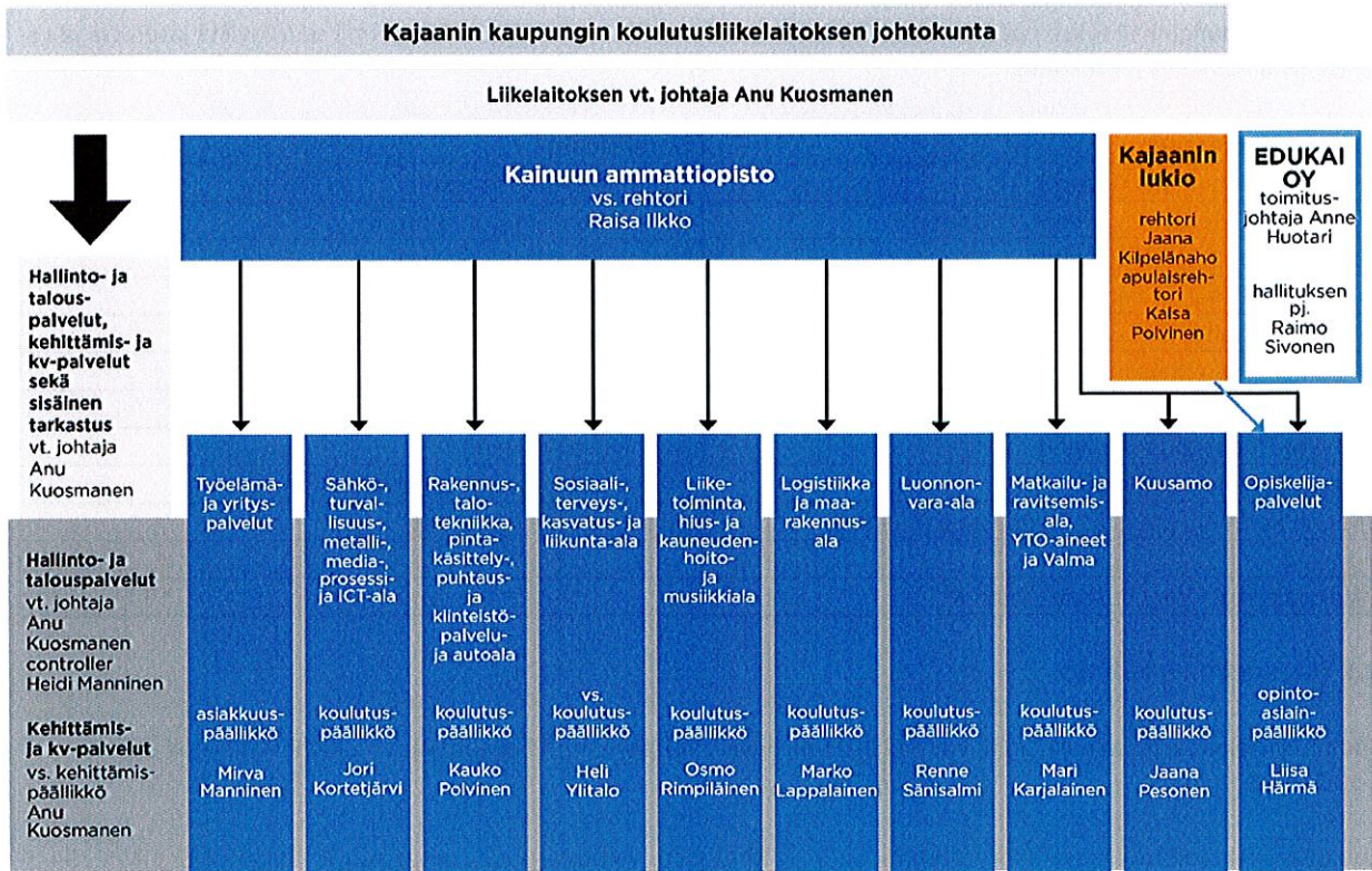
Kuva: Koulutusliikelaitoksen organisaatio 31.12.2022.